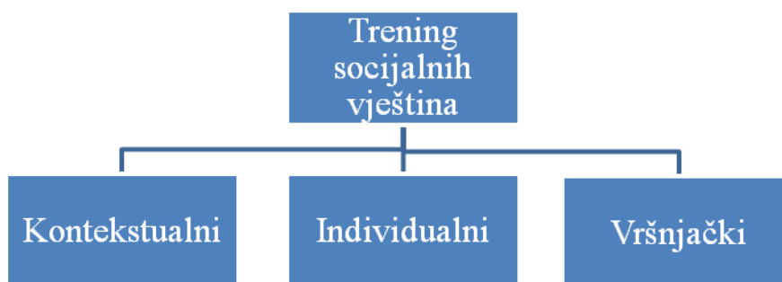
Graf 1 – Pristupi u svladavanju socijalnih vještina

Ne postoje univerzalno učinkoviti tretmani koji imaju pozitivan utjecaj na razvoj sposobnosti djece s autizmom. Priče za učenje socijalnih vještina se u prvom redu koriste u cilju treninga socijalnih vještina. Čitav niz tretmana bazira se na prilagodbi okruženja kako bi se olakšale socijalne interakcije. Takvi tretmani su po svojoj prirodi kontekstualni. Priče za učenje socijalnih vještina pripadaju grupi individualno orijentiranih intervencija kojima se potiče razvoj socijalnih vještina osobe sa kojom radimo. Nekada se na razvoju socijalnih vještina radi posredno tako što se vršnjaci djeteta s autizmom podučavaju kako pružiti primjerenu podršku djetetu s autizmom u različitim socijalnim situacijama. Ova tri pristupa se mogu primjenjivati zasebno ili u kombinaciji.